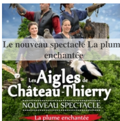
Le nouveau spectacle La plume enchantée