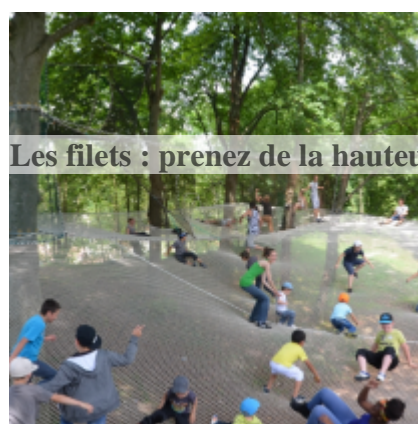
Les filets : prenez de la hauteur