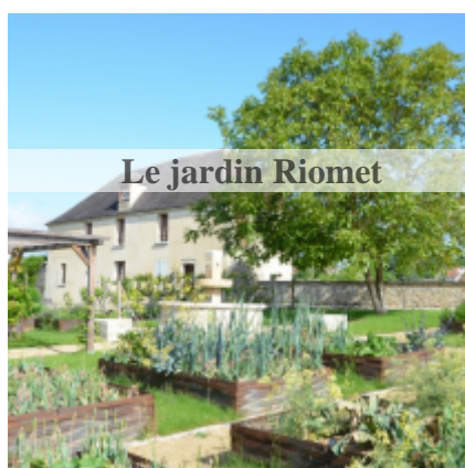
Le jardin Riomet