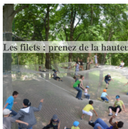
Les filets : prenez de la hauteur