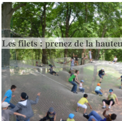
Les filets : prenez de la hauteur