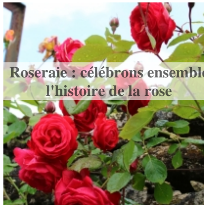
Roseraie : célébrons ensemble l'histoire de la rose