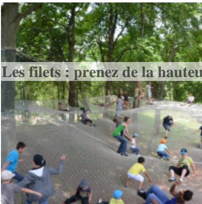
Les filets : prenez de la hauteur