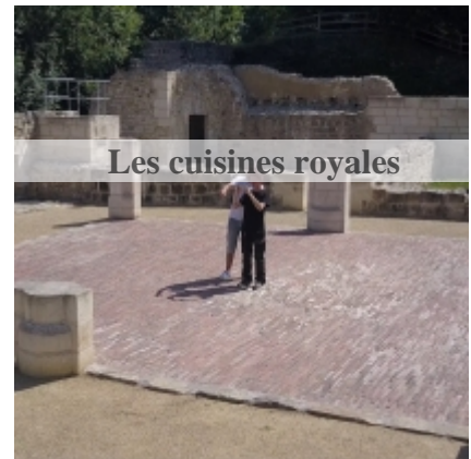
Les cuisines royales