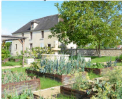
Le jardin Riomet