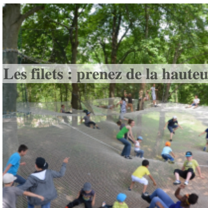
Les filets : prenez de la hauteur